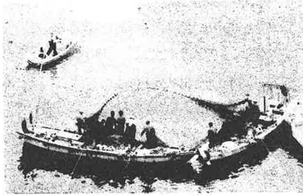
昭和40年ごろのちりめん漁の風景

昭和35年ごろまではほうたれ漁が主で夜は沖(ほうたれ漁)に出て昼は山(マツマイも・なし)で生計を立てていました。が、このころを界に海は昼間のちりめん漁に山は柑橋類に変わってきました。当時の生活はとても裕福とはいえませんが地域の人みんな同じ仕事を行い、どこの家の子供も自分の家の子供のように育てられました。義理・人情たっぷりとても心豊かな地域です。今もその気持ちだけは受け継がれています。